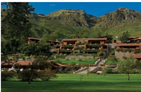
Belmond Rio Sagrado