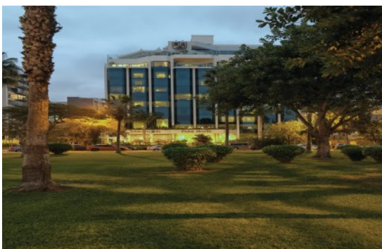
Belmond Miraflores Park